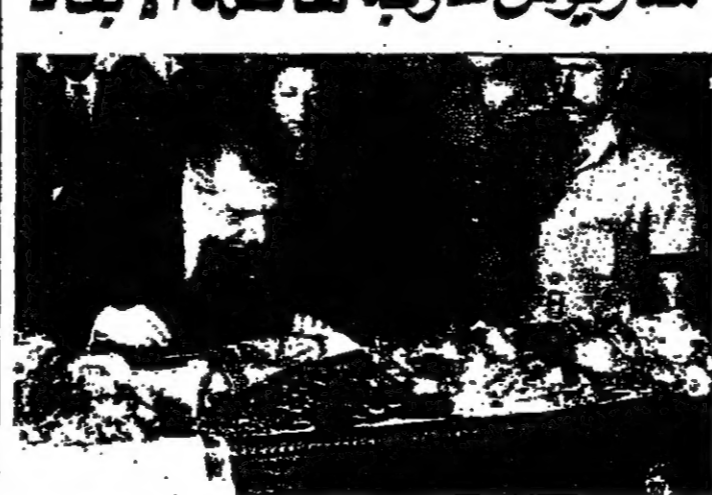
سيروس كاريوس رئيس الجمهورية بالوكالة ينهض ليقبل يد المخبرين مكاريسون

وهو يعرف ما يريد أن يفعله العرب وما يستطيعون تقديمه. فقد التقى بهم جميعاً، وسعى أن يتولاهم في الأمر والمال. ومؤلفه لم يتصوروا. فانس، وهو الرجل الأول الذي ساعد في طلبة وزير الخارجية الأمريكية في واشنطن. بل هو السفير الذي يحرس الرئيس كارتير على حياته وهو يتجول في كل لحظة.